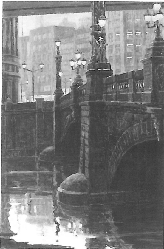
第59回示現会展(2006) 示現会賞 日本橋

上野、浅草、有楽町、東京、日本橋、新宿など人の流れのある駅、商店街、街角などが取材対象になるのですが、取材にでかけるといふより、日常街中を歩いている時に、偶然はつとずる場面、光景に出会えた時に創作意欲をそそられる。