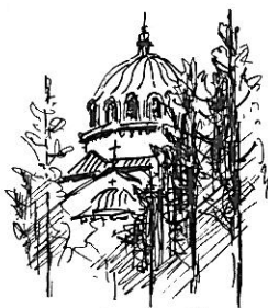
ふたの水 ニコライ

上野駅の浅草口を出た広場はタクシー・バスの乗り場で賑わい、その上に広場を擁した横断陸橋が昭和通りまで跨いでいる。昭和通り越しに駅近辺のビルや広場をながめると今の時代のターミナルの感がある。